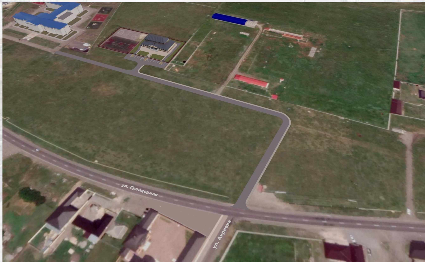
«Благоустройство общественной территории в с.п. Кантышево» (ул. Грейдерная)