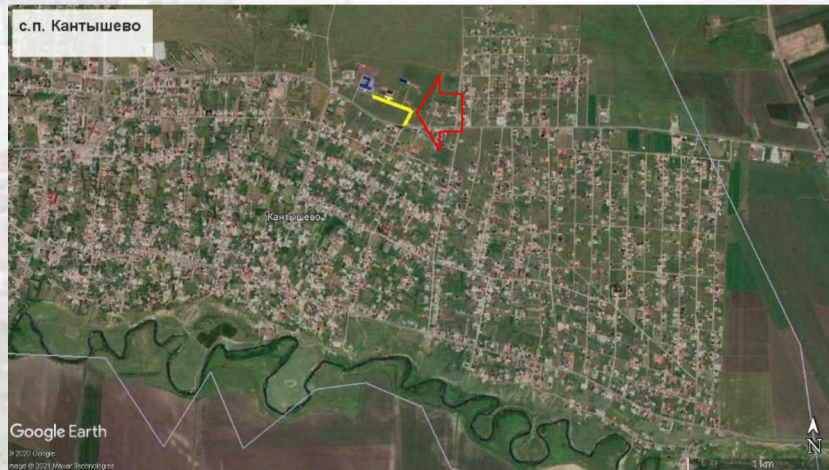
с. Кантышево. Ситуационная схема благоустраиваемой территории

Настоящий дизайн проект выполнен в целях обеспечения реализации приоритетного проекта «Формирование комфортной городской среды», в рамках выполнения муниципальной программы «Формирование современной городской среды на территории Назрановского муниципального района на 2018-2024годы».